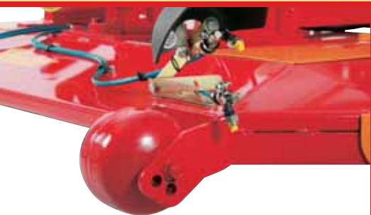
Herbicide spraying head with two own sprays

¡Todas las ventajas de una experiencia de décadas! La estructura de la cortadora de césped SLF es lisa y compacta, con un perfil extremadamente bajo (16 cm) y con las esquinas achaflanadas. Es apta para cultivos con frutos colgantes bajos, y ¡alcanza los puntos más profundos de la hilera, gracias al amplio desplazamiento lateral! El peso reducido permite trabajar con poca absorción de potencia, con la posibilidad de combinar al corte del césped, el tratamiento de escarda, o bien ¡el tratamiento de las plantas con atomizador!