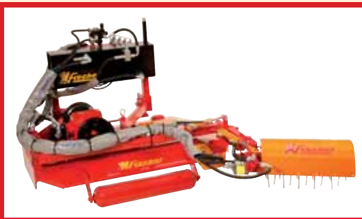
Brush Twister with self supply pump and tank