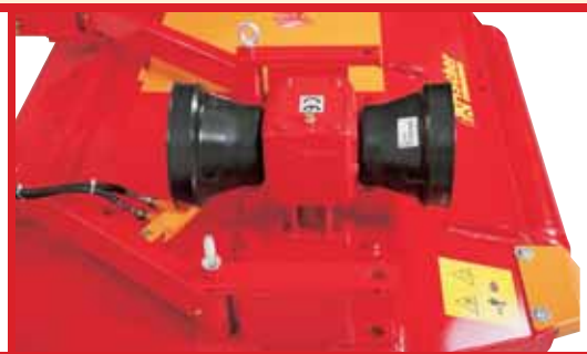
Front and rear mounting with gear drive output shaft for changing rotating direction