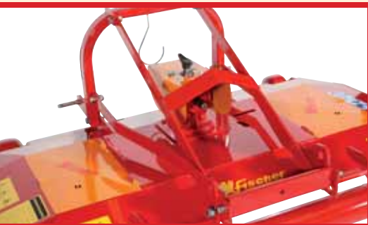
Support for spraying equipment mounting with gear drive output shaft