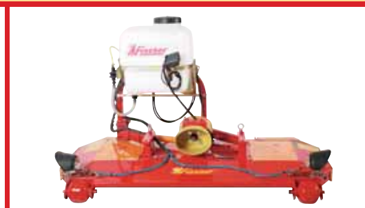
SLF-M front mounting with hydraulic outreach on the left