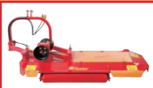
SLF with parallelogram displacement